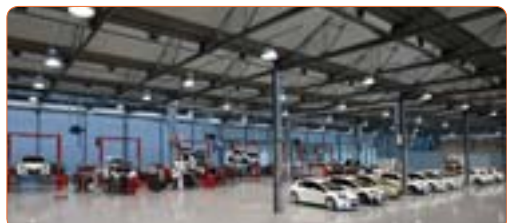
Un interno della nuova sede Abarth

Apri la Ceccato Racing, concessionaria Abarth per Vicenza, Padova, Rovigo e Venezia