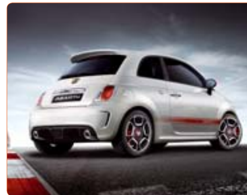
La Fiat 500 Abarth (2008)

meccanica, della sicurezza e della tecnologia. La Casa ha pensato anche agli appassionati più sportivi, per chi, proprio come Carlo Abarth, ama le competizioni grintose. Oltre alla versione stradale elaborata con il kit di trasformazione, infatti, la 'piccola' Abarth sarà disponibile anche con un allestimento sportivo - 500 Abarth SS Assetto Corsa - dedicato ai clienti che si vorranno cimentare nelle competizioni in circuito.